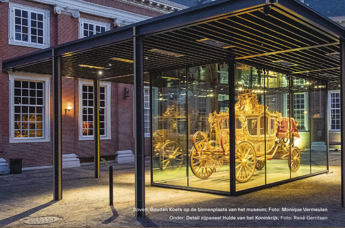
Boven: Gouden Koets op de binnenplaats van het museum; Foto: Monique Vermeulen Onder: Detail zijpaneel Hulde van het Koninkrijk; Foto: René Gerritsen