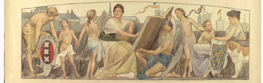
Ontwerptekeningen door Nicolaas van der Waay voor de beschildering van de zijkanten van de Gouden Koets. Collectie Stadsarchief Amsterdam