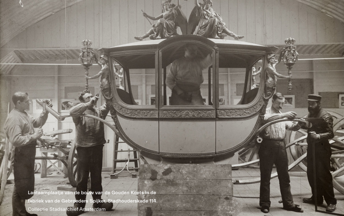
Lantaarnplaatje van de bouw van de Gouden Koets in de fabriek van de Gebroeders Spijker, Stadhouderskade 114.

Maar we zien ook dat de Gouden Koets al sinds zijn ontstaan protest oproept. Tegenstanders van de monarchie gooiden de afgelopen eeuw rook-, verf- en waterbommen naar de koets. Nu is er kritiek op de Gouden Koets vanwege de manier waarop het kolonialisme is verbeeld. Volgens velen hoort die symboliek niet thuis op feestdagen die alle Nederlanders mee willen kunnen beleven.